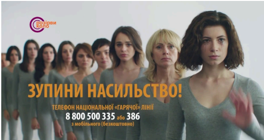
Рисунок 2. Інформаційні кампанії щодо ГЗН зображують жінок як єдиних постраждалих від насильства