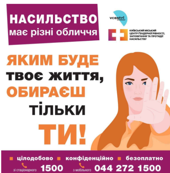
Рисунок 4. Інформаційні кампанії щодо ГЗН використовують наказову мову та заохочують повідомляти про випадки насильства

Під час інформаційних кампаній слід бути обережними із закликами до постраждалих повідомляти про випадки ГЗН, оскільки люди, як правило, розуміють, що їм слід звертатися до державних установ. Безпечніше спрямовувати їх до організацій, які спеціалізуються на правах жінок, ЛГБТКІА+ або ромської спільноти, або інших, які з більшою ймовірністю нададуть відповідну допомогу. Інформаційні кампанії та матеріали, що роз'яснюють повноваження відповідних державних органів, НУО та громадських організацій, також можуть допомогти постраждалим, які шукають підтримки.